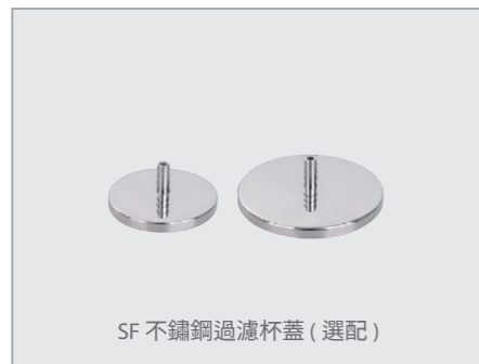
SF 不鏽鋼過濾杯蓋 (選配)